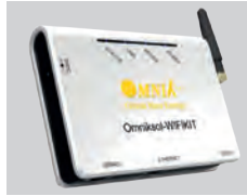
Externe Wi-Fi kit